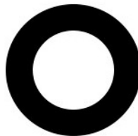
Тип I Однослойная труба